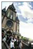
A címlapon :: A zugligeti Szent Család templom a Befogadás Napján

szolgálat Egy árvízi önkéntes naplójából 16. oldal